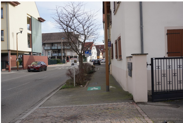
Absence de délimitation pour les piétons (dimensions insuffisantes et obstacle pour les personnes mal voyantes)