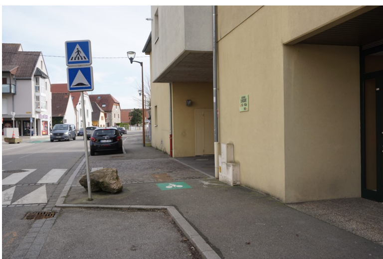
Sortie parking résidence - aucune ma- térialisation au sol pour les véhicules qui sortent de la résidence et manque total de visibilité.