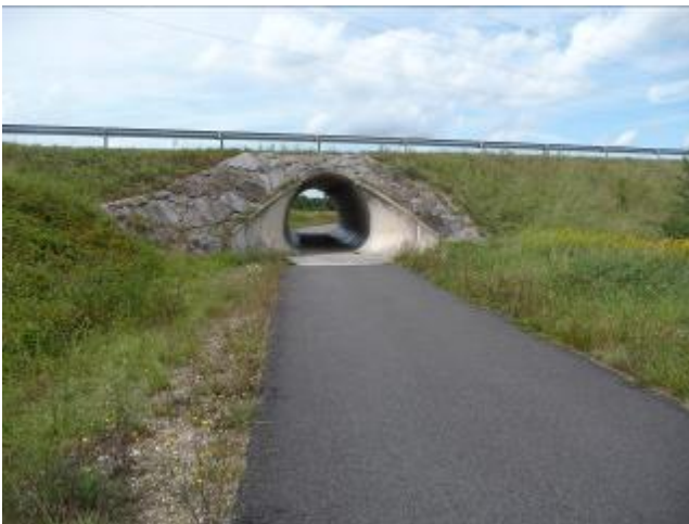
Passage cyclable inférieur (Niffer)