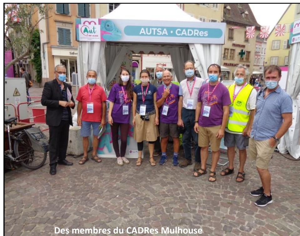
Des membres du CADRes Mulhouse

A Brunstatt-Didenheim, un petit groupe de cyclistes désire s'investir et souhaiterait qu'une démarche participative puisse voir le jour. L'ouverture et la discussion sur les nouveaux projets ne peuvent être que bénéfiques pour l'ensemble des partenaires et dans l'intérêt des habitants de la commune. Conformément à la loi, pratiquement dès qu'il y a des travaux de voirie, la prise en compte des cyclistes est obligatoire. En conséquence, il serait fructueux et judicieux qu'un échange constant soit mis en place avec ce groupe (dès à présent par rapport à ce nouveau giratoire de la rue de la Libération) et tenter d'améliorer la circulation des vélos dans la commune en général.