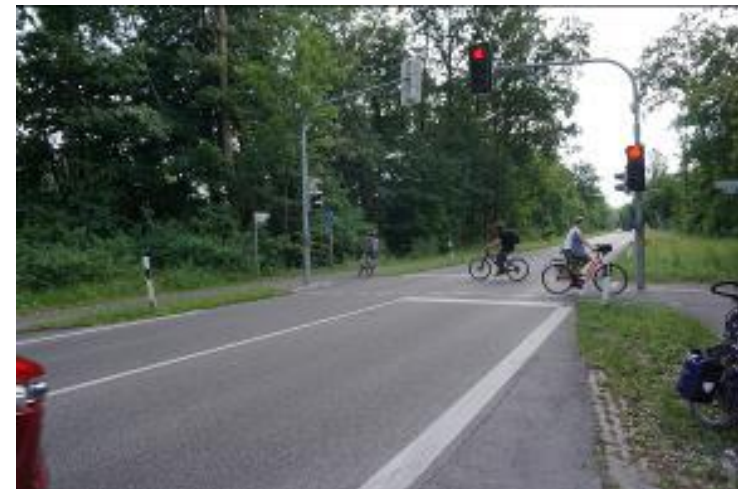
Traversée cyclable protégée par des feux avec bouton poussoir très réactif (D)