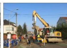
La conduite d'eau est remplacée depuis la rue de Letterbach jusqu'au carrefour.