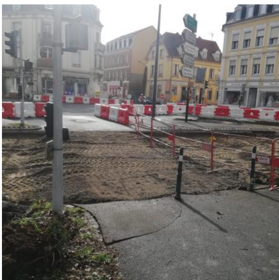
Carrefour av. Colmar/Mertzau