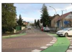
Le virage au bas de la rue Schoff, avant sa réfection, avec la rue de la Plaine à sa droite.