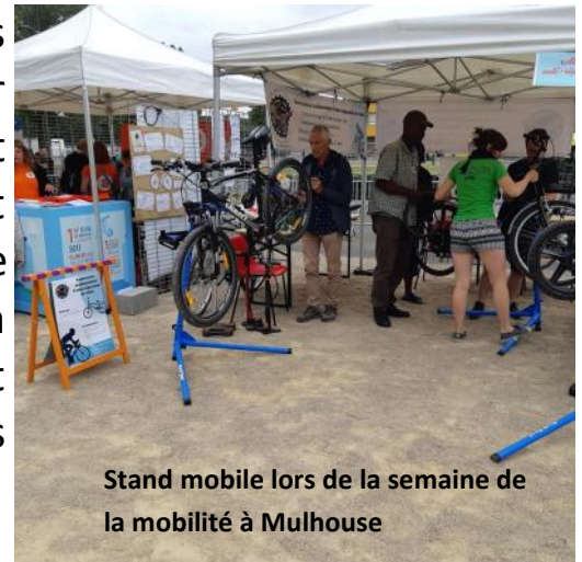
Stand mobile lors de la semaine de la mobilité à Mulhouse