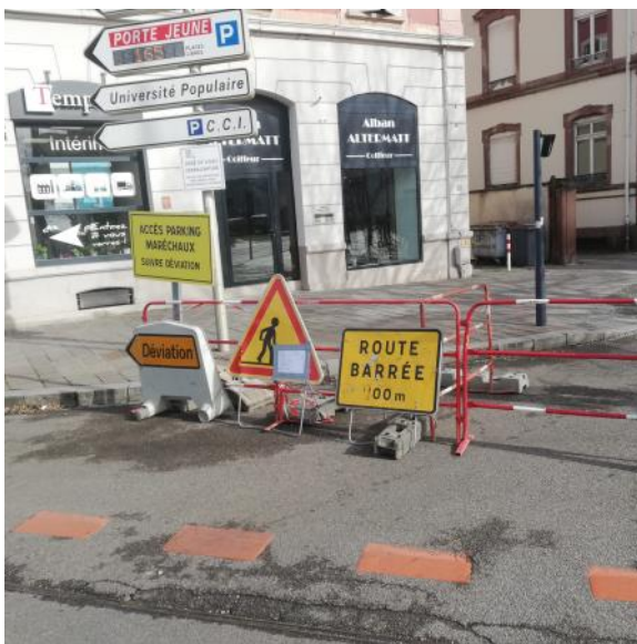
Rue de l'Arsenal

Des travaux ont démarré à différents lieux de la ville. Certains de ceux-ci entrent dans le cadre de la programmation des aménagements vélo. Toutefois, comme nous l'avons déjà souvent évoqué, lors de travaux de voirie, il faut tenir compte de la circulation des cyclistes, or le constat est accablant, on n'existe pas ! Cela confirme bien les résultats du baromètre des villes cyclables ou la notation était vraiment mauvaise.