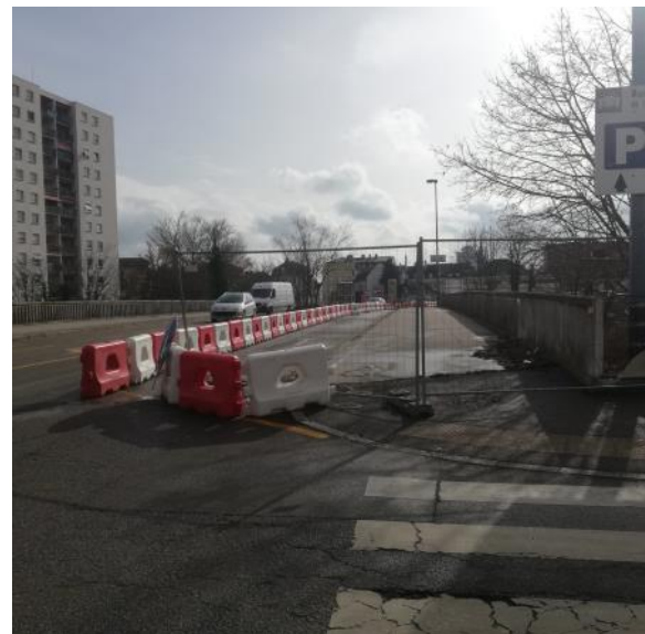
Avenue de Colmar