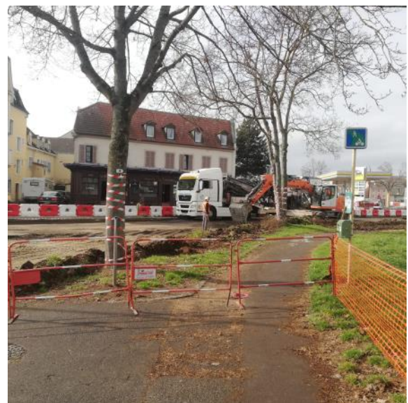
Avenue de Colmar