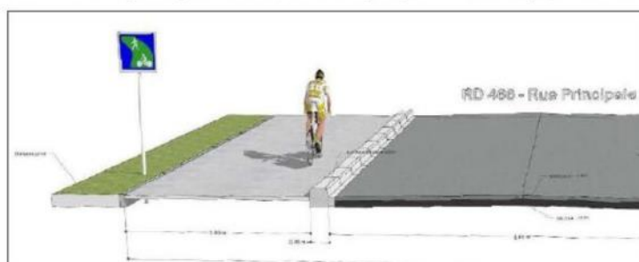
L'aspect de la future piste cyclable à partir de l'entrée Est de Lauw. Document JP études et conception

Retrouvez les liens des articles complets à la fin du document.