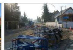
Une fois le réaménagement du carrefour terminé, des bacs verts seront créés du côté des arbres existants.