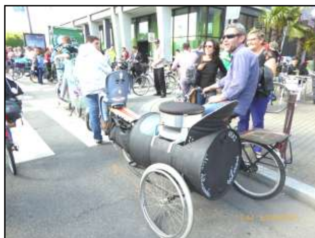
Pas encore disponible au CADRes: la remorque-crêpière !

A noter également que la boutique Vélo Station sise Cour des Maréchaux octroie des rabais sur certaines prestations aux membres de l'association.