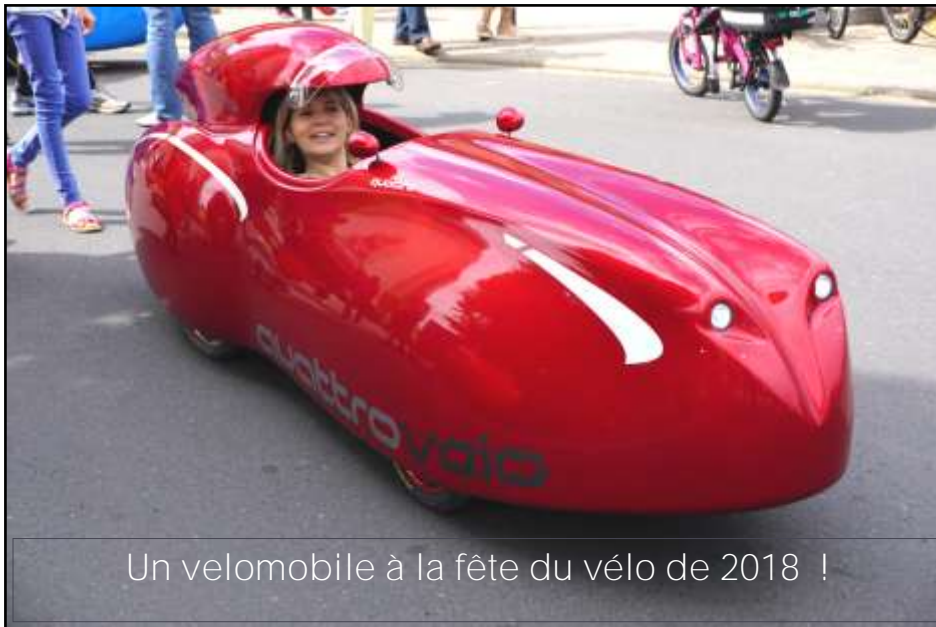
Un velomobile à la fête du vélo de 2018 !