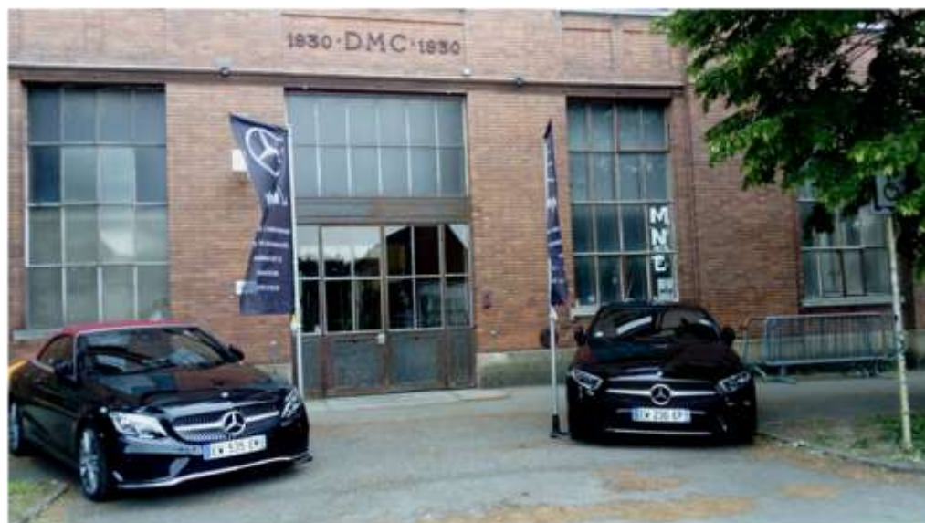
DMC le 3 mai 2018, un site qui devait laisser les voitures en dehors du quartier

Mais pourtant on persiste à vanter les mérites des véhicules motorisés en tout genre. Comme par exemple à DMC, vous savez ce site que l'on osait déjà comparer à l'éco-quartier Vauban à Freiburg au moment où sortaient les esquisses architecturales ! Résultat, on peut venir effectuer un lancement-promotion d'automobiles moyennant finances à l'intérieur du bâtiment 75 !