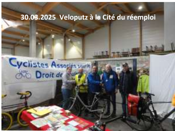
30.03.2025 Veloputz à la Cité du réemploi