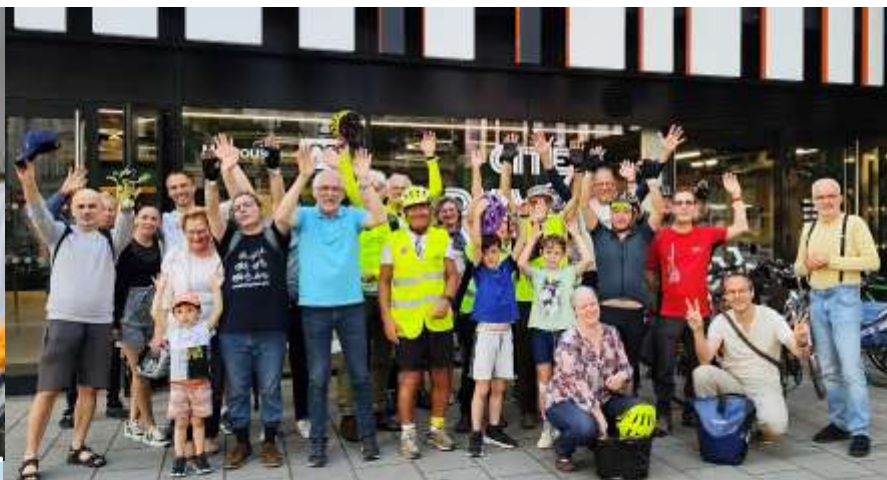
Vélorution du printemps, fête du vélo, un maître mot au CADRes : la convivialité !